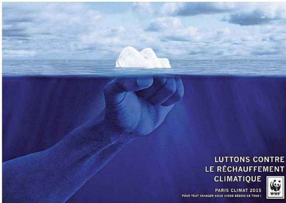
Création graphique de Jean-Philippe Bonnier. Deuxième Prix du Jury, concours Creative Awards by Saxoprint organisé à l'initiative de WWF. © Jean-Philippe Bonnier

Au Bourget, jusqu'au 11 décembre, 195 États sont réunis pour trouver un accord international de lutte contre le réchauffement climatique. En parallèle, des installations artistiques fleurissent un peu partout dans Paris... Pendant que les États négocient, les artistes vont à la rencontre du public pour sensibiliser l'opinion aux enjeux environnementaux. Un parcours souvent spectaculaire.