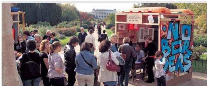
© Lucy - Jorge Orta