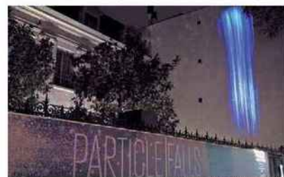
© Andrea Polli / Jared Rendon-Trompak

Juger de la qualité de l'air en temps réel, tel est l'objet de l'installation Particle Falls , une projection lumineuse interactive face à laquelle on prend conscience du taux de particules fines en suspension... Un projet signé Andrea Polli, déjà présenté aux États-Unis, qui mêle représentation esthétique et données fondamentales sur l'environnement : une manière artistique de sensibiliser les citoyens.