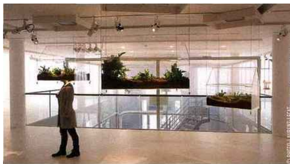
L'exposition à la Fondation EDF présente 30 installations en lien avec le changement climatique