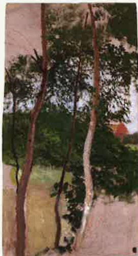
Otto Modersohn, Landschaftsstudie mit Birken und Haus, 1898

Die stete Auseinandersetzung mit dem Thema Landschaft veranlasste Otto Modersohn (1865–1943), die Natur in all ihren Erscheinungsformen und zu allen Jahreszeiten künstlerisch festzuhalten. Sein gesamtes Leben strebte er nach poetischer Empfindsamkeit und Einfühlung in das Wesen der Natur. Eine Ausstellung im Otto Modersohn Museum bietet jetzt einen abwechslungsreichen Jahreszeiten-Rundgang mit Otto Modersohn und blickt dabei besonders auf sein Haupt- und Spätwerk. Neben den klassischen Darstellungen offenbart die Ausstellung, wie sehr der Künstler auch die unbestimmten Übergänge, das kaum merkbare Gleiten von einer Jahreszeit in die nächste, und der damit verbundene Lichtwechsel interessiert haben.