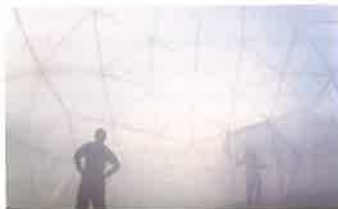
Michael Pinsky, Pollution Pods, 2017

Dem Thema Nachhaltigkeit widmet sich der britische Künstler Michael Pinsky mit seiner Installation „The Final Bid“, die er in der Draiflessen Collection erstmals realisiert. Auf spielerische Art lädt Pinsky die Menschen ein, in einer symbolischen Aktion den nicht abbreißenden Konsum neuer Waren zu durchbrechen. Beispielhaft hat er sich dabei für das ikonische Objekt des Stuhls entschieden und ruft dazu auf, nicht mehr benötigte Stühle zum Verkauf ins Museum zu bringen. Auf der Ausstellungsfläche werden sie Teil einer Installation, die sich durch den Auktionsprozess ständig verändert und am Ende wieder auflöst. Im Außenbereich wird während der ersten vier Wochen der Ausstellung ein weiteres Werk von Pinsky zu sehen sein: Die Installation „Pollution Pods“ simuliert